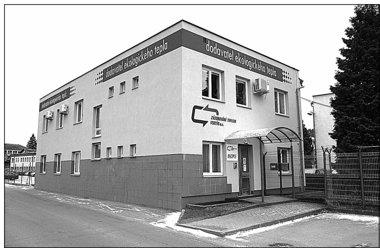
Zásobování teplem Vsetín - Provozní budova